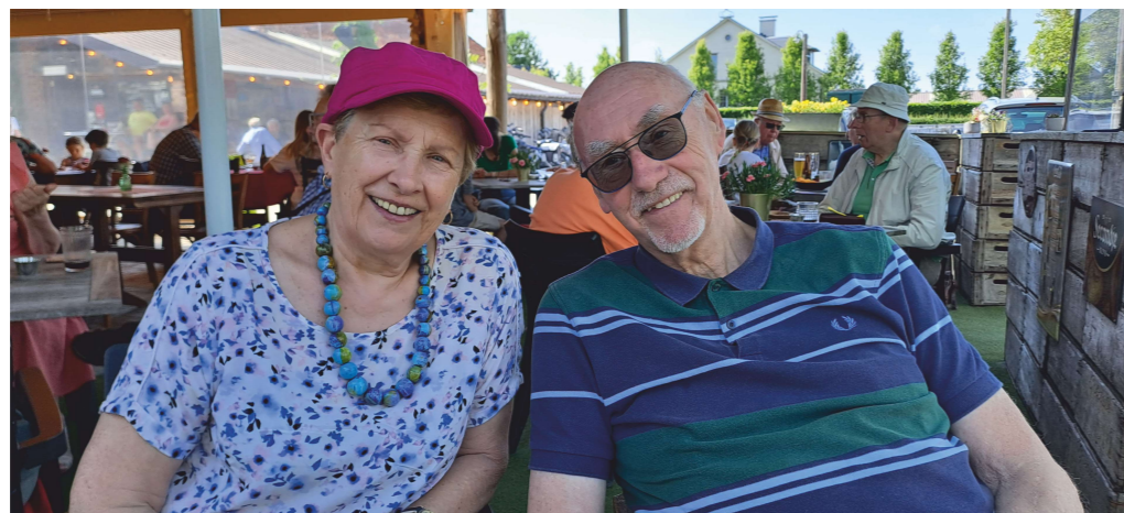
Rouwcentrum Van Damme - Lebbeke - www.rouwcentrum-vandamme.be - 052 41 44 55